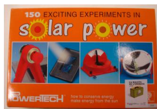
150 EXCITING EXPERIMENTS IN SOLAR POWER. Powertech

Per a cicle mitjà i superior de primària les activitats se centren en les següents tipologies d'energia: hidràulica, magnètica, mecànica, eòlica, elèctrica i electromagnètica.